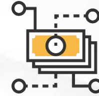
Reporting Economico, Finanziario e Patrimoniale