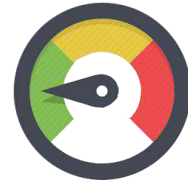
Kpi e Dashboard