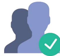
Human Resource Reporting